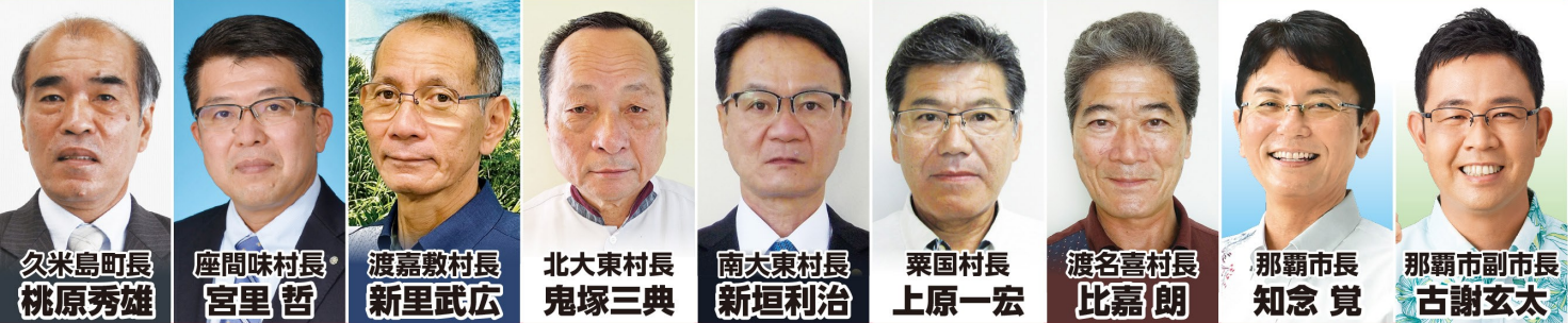
久米島町長 桃原秀雄 座間味村長 宮里 哲 渡嘉敷村長 新里武広 北大東村長 鬼塚三典 南大東村長 新垣利治 粟国村長 上原一宏 渡名喜村長 比嘉 朗 那覇市長 知念 覚 那覇市副市長 古謝玄太