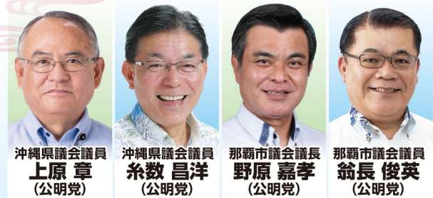
沖縄県議会議員 上原 章 (公明党) 沖縄県議会議員 糸数 昌洋 (公明党) 那覇市議会議員 野原 嘉孝 (公明党) 那覇市議会議員 翁長 俊英 (公明党)