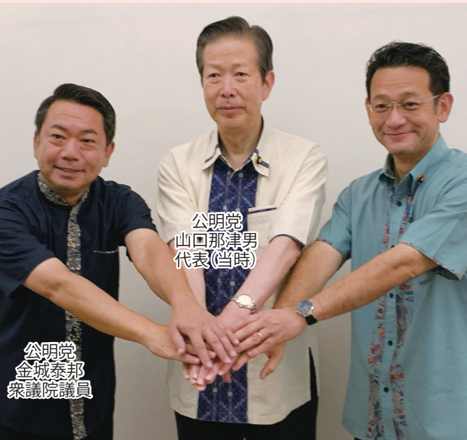
公明党 金城泰那 衆議院議員